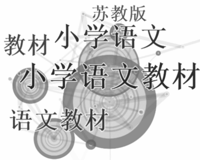
图 2 小学语文教材关键词共现频次聚类图谱(跨度:1 年)

节点,圆圈的大小表示该关键词出现的频次高低,圆圈的颜色和厚度表示出现时段,即圆圈内色环薄厚,表明的是该颜色对应年份出现的关键词频次的高低。从图 1 可以清晰地看出,1954—2018 年这个时间段内最大的关键节点是“小学语文教材”,结合表 1 被引频次的的数据可以确定小学语文教材研究领域的热点。从知识理论的层面来看,中心度和频次高的关键词代表着一段时间内研究者共同关注的问题,即研究热点 [9] 。如表 1 所示,研究文献中出现频次较高的关键词有“小学语文教材”、“小学语文”、“语文教材”、“教材”、“苏教版”、“教学策略”、“插图”、“小学”、“规范”等。